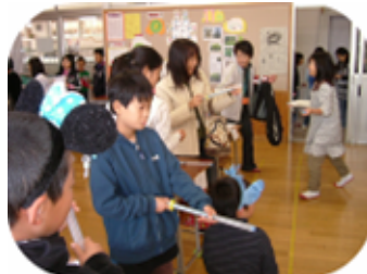
5年 あてあて5(ファイブ)

牛田の町ふれあいゲームラリーは、3年生以上の各学級で出し物を考え、それを異学年グループで体験することで、友達と協力して活動したり、地域の人々とふれあったりすることを目的とした児童会活動です。子どもたちは計画段階から張り切って活動し、準備や運営などを自主的に進めることができました。当日は、たくさんの保護者や地域の方々にご来校していただきました。ありがとうございました。