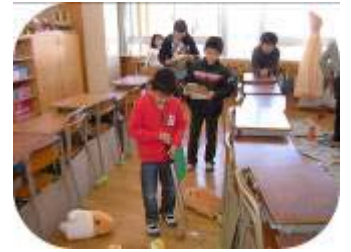
6年 めざせ石川りょう