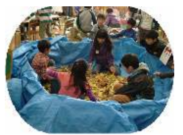
3-1 ミッキーをさがせ

牛田の町ふれあいゲームラリーは、3年生以上の各学級で出し物を考え、それを異学年グループで体験することで、友達と協力して活動したり、地域の人々とふれあったりすることを目的とした児童会活動です。子どもたちは計画段階から張り切って活動し、準備や運営などを自主的に進めることができました。当日は、たくさんの保護者や地域の方々にご来校していただきました。ありがとうございました。