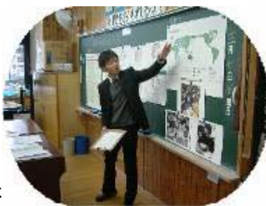
5年4組 言語数理運用科

授業では、子どもたちがいつも以上に集中して学習していました。また、その後の懇談会には、多くの保護者の方に出席していただき、ありがとうございました。2月が今年度最後の参観・懇談会になります。ぜひおいでいただき、子どもたちの成長した姿を見ていただきたいと思ひます。よろしくお願ひします。