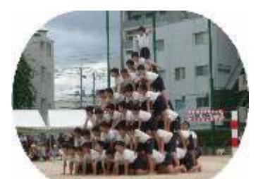
6年 組体操 ~ボクらの歴史~