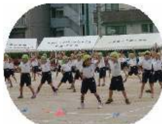
1年 ちびっこ エグザイル

また、PTAの皆様準備や当日のお手伝い、ご来賓の皆様、保護者や地域の皆様の声援のおかげで、練習の成果を十分に発揮することができました。ご支援とご協力に感謝いたします。ありがとうございました。